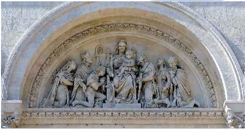
Dombormű a Pécsi székesegyház bejárata felett (1891)