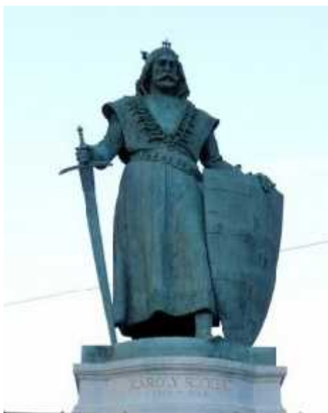
Károly Róbert szobra (1905) Budapest Hősök tere

elképrázta a hatalmas építkezések sora. Hamarosan megbízták az Operaház részére két szobor elkészítésével: Jacopo Peri zenekölt és Palestrina zeneművész szobrának elkészítésével. Majd a Honvédelmi Palotában egy Árpád fejedelem szobor elkészítésére kapott megbízást.