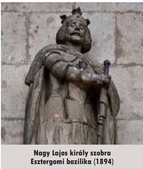
Nagy Lajos király szobra Esztergomi bazilika (1894)