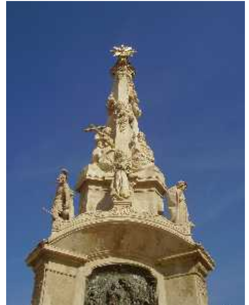
A Szentháromság-szobor napjainkban