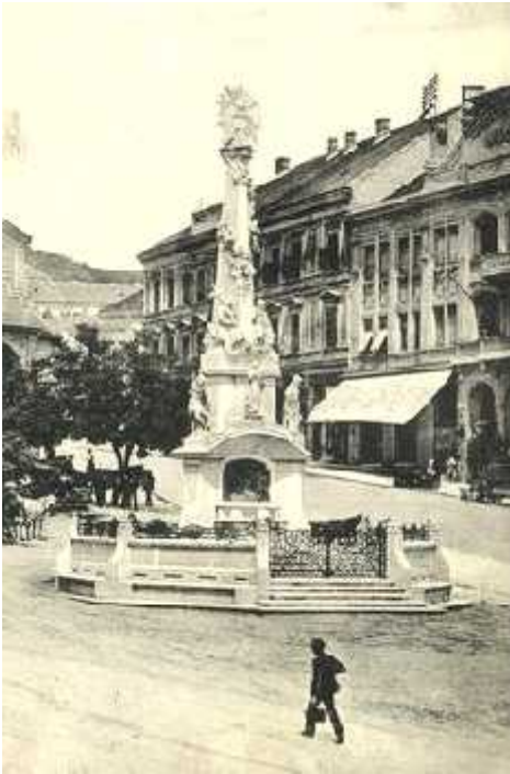
Szentháromság-szobor Pécs, Széchenyi tér (1908)