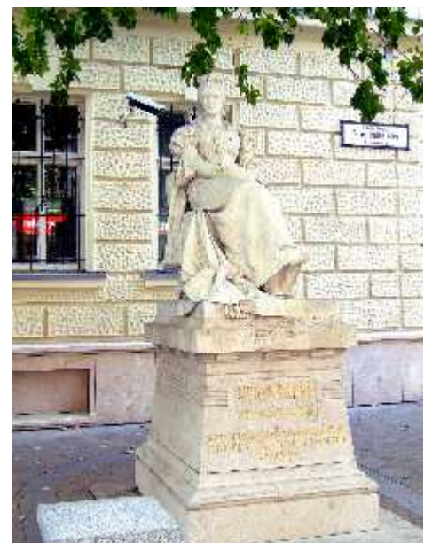
Veres Pálné emlékszobor a budapesti V. kerületi Veres Pálné utcában(1906)

München után itthon 1000 forint ösztöndíjat kapott, hogy tovább folytathassa tanulmányait. Budapesten el ször járt, és