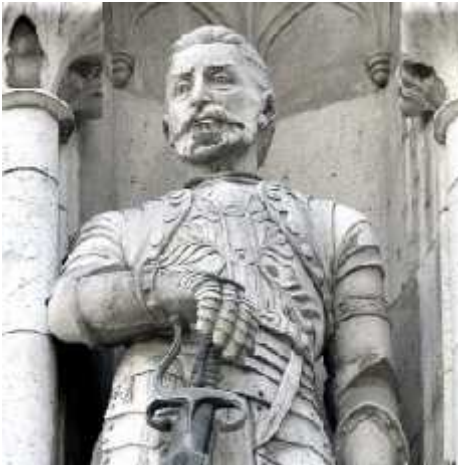
Jurisics Miklós Országház - keleti homlokzat (1905)

Kiss György ekkoriban sokat pihen, keveset alkot, inkább fia tehetségében gyönyörködik. Károly önálló, nagy formátumú művészeket hívatott, mint közismert apja. Aztán az esztergomi érsek újra magához hívatta, és szobrokat, oltárokat rendelt. A három kassai vértanú szobrát rendelte a középső oltárra. Az első mintát egy elfogadták, így apa és fia Esztergomba utazott, és nekikezdtek a márványszobornak. Kiss György letette addig elhagyhatatlan szivarját, mert torkát fájlalta, de hamar túltette magát az átmenetinek gondolt betegségen. A szobor elkészült, hatalmas sikert aratott. Ezután a politikai helyzet miatt, már egyre kevesebb pénz jutott művészetre, a hadügyi kiadások kerültek előtérbe.