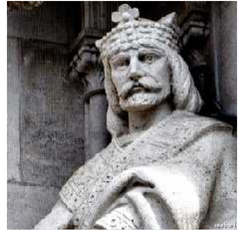
Országgház - nyugati homlokzat Orseolo Péter