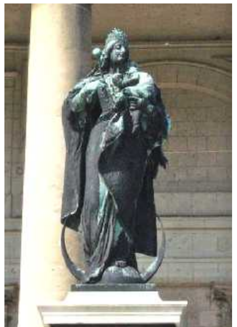
A magyarok nagyasszonya (1905) az esztergomi bazilika előtt