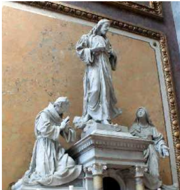
Jézus Szíve-oltár szobrai, Esztergom (1897)

Ebben az időben kapta meg a pápai kitüntetését, amire még Dulánszky püspök terjesztette fel. A Vatikán meghozta döntését, és „Pro Ecclesia et Pontifice” kitüntetés adományozott Kiss Györgynek. Ezzel „nagyapapai” elnévre lett jogosult, és lovagi címet kapott. De ezeket