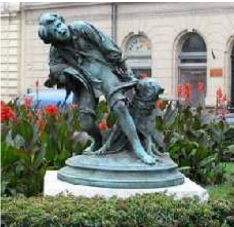
A Csirkefogó című (VIII. ker.) 1 m-es bronz szobrot 1927-ben készítette.