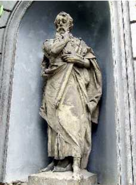
Szent Pál szobra a pécsi Martyn ház bejáratánál (1902)

1868-ban bérmálásra készült a falu. Kisséknél az ablakba tették ki díszként a faragott keresztet, feszületeket. A püspök kíséretében haladó Troll Ferenc kanonoknak felt ntek a faszobrok. Még aznap behívták a plébániára, és a szül l kkel megegyeztek a gyermek taníttatásában. Pár hónap múlva megkapta az