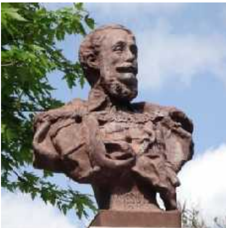
Kossuth Lajos Avatás: 1902 Kemece, Kossuth utca